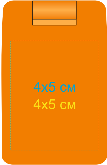
Сторона с швейным набором 7114/05