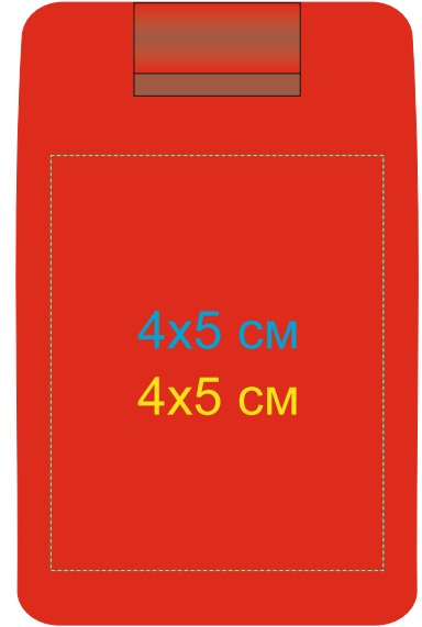
Сторона с зеркалом 7114/08