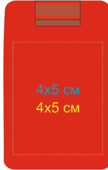
Сторона с швейным набором 7114/08