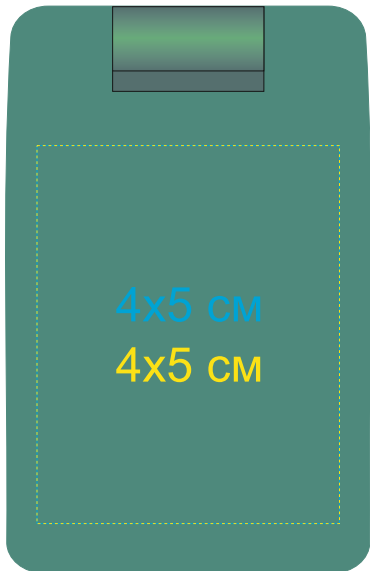
Сторона с швейным набором 7114/15