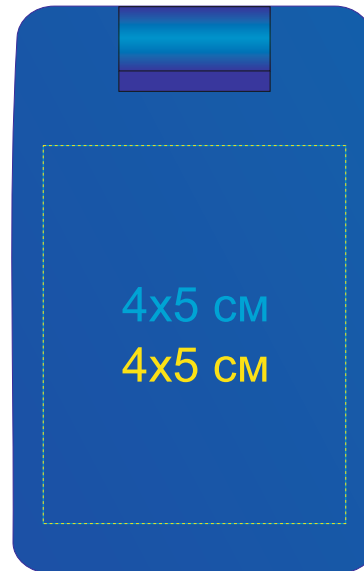
Сторона с швейным набором 7114/24